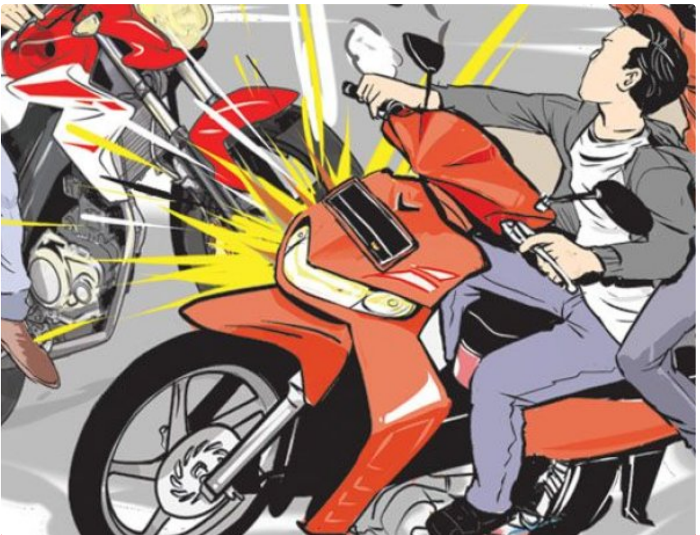
Ilustrasi laka lintas

BANYUWANGI - Dua unit sepeda motor mengalami kecelakaan lalu lintas adu banteng di Jalan Raya Jember, Desa Tulungrejo, Kecamatan Glenmore, Kabupaten Banyuwangi, Jawa Timur. Lakalantas yang melibatkan sepeda motor